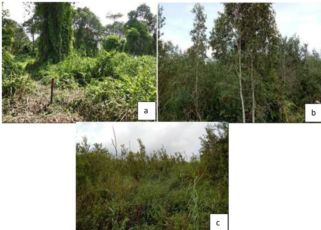
Gambar (Figure) 2. Keterangan: a. Terbakar tahun 2015, b. Terbakar tahun 2017 dan c. Terbakar tahun 1997, 2015 dan 2017 ( Remarks: a. Forest burnt in 2015, b. Forest burnt in 2017 and c. Recurring forest burnt in 1997, 2015 and 2017 ).