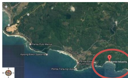
Gambar 1 Lokasi Pengamatan

Penelitian ini dilaksanakan di Pantai Seupang Kabupaten Lebak, Banten (gambar 1). Waktu penelitian dilaksanakan mulai bulan Januari sampai bulan Juli 2020.