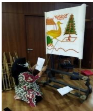
Gambar-07 sliji dan ampok

Penulis dan team kreatif merasa perlu mengadakan workshop. Sebuah tahapan-tahapan yang menekankan pengetahuan praktis dan mudah dicerna oleh guru dinamakan workshop (Sudanta, 2015) Workshop cara memainkan atau menggelar sebuah pertunjukan Wayang Beber Fabel. Wayang Beber Fabel ini mengambil tempat di lab. Kesenian FISIB. UNPAK (Universitas Pakuan Bogor). Pada workshop pertama mendatangkan atau mengundang guru-guru Paud Gandaria Bogor beserta murid-murid serta orang tua mereka. Workshop hari kedua diteruskan ,dengan agenda mengajarkan cara menutur dan memahami konsep pertunjukan Wayang Beber yang akan digelar. Ibu guru PAUD bertindak sebagai pembeber atau dalang dalam pertunjukan ini. Cara memainkan Wayang Beber membelakangi penonton atau anak-anak PAUD. Ibu guru mulai menceritakan Wayang Beber per-adegan. Sebelum dimulai acara Ibu guru memperkenalkan gambaran pertunjukan dan berdoa terlebih dahulu. Setelah itu dilanjutkan dengan proses awal membeber. Guru mengawali dengan cara memberikan cerita isi sinopsis. Kemudian dilanjutkan dengan membalikan badan. Kemudian dalang atau penutur meghadap lukisan adegan pertama. Ibu guru memakai alat atau penunjuk untuk memberikan penekanan terhadap karakter atau tokoh yang sedang dinarasikan. Kemudian dilanjutkan ke adegan kedua dan ketiga. Untuk perpindahan adegan dilakukan dengan mengulung kain lukisan dengan sliji (dua tiang kayu). Tiang ini berfungsi untuk mengulung lukisan kain Wayang Beber.