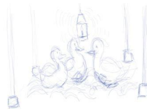
Storyboard 2 : Terlihat perbincangan Antara Merah, Kuning dan Coklat