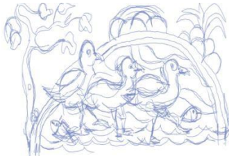
Storyboard 3 : Terlihat Merah, Kuning, dan Coklat, hendak menyusul Ibu-nya