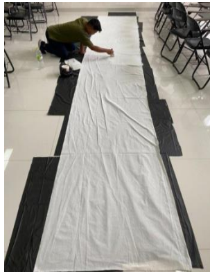
Gambar-04 Pemberian Dasaran Warna

Kain blacu memiliki rongga yang harus ditutup. Penutupan dilakukan untuk menghindari pemakaian cat secara berlebihan atau boros. Penutupan rongga dilakukan dengan cara memakai cat akrilik warna putih yang dicampur dengan air. Campuran diaduk hingga rata kemudian disapukan dengan kuas di atas permukaan kain blacu. Kain blacu yang telah tutupi cat dasaran ditunggu hingga mengering.