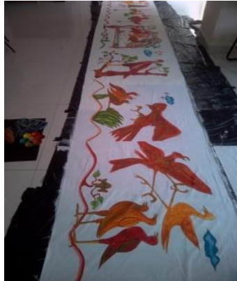
Gambar-05 Lukisan yang telah selesai