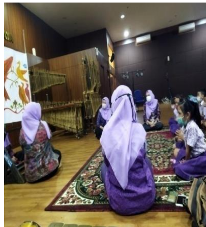
Gambar-08 Workshop hari ke-empat

Pada hari keempat situasi di kondisikan seperti pertunjukan yang nyata. Konsep pertunjukan dilakukan secara utuh dari proses awal pembukaan kemudian ibu guru sebagai penutur atau dalang mulai memberikan pembukaan acara. Kemudian dilanjutkan dengan membeberkan per-adegan. Untuk keperluan dokumentasi dilakukan perekaman. Perekaman memakai dua kamera. Kamera pertama sebagai master dan kamera kedua yang bergerak mengambil gambar dari arah sisi dalang atau dari sisi penonton. Outputnya berupa video dokumentasi pertunjukan dari awal hingga akhir.