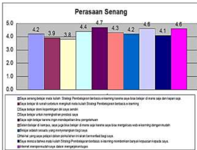
Gambar 4 Indikator Minat Belajar berupa Perasaan Senang

Berdasarkan data di atas dapat dilihat bahwa minat belajar mahasiswa yang mendapat mata kuliah Strategi Pembelajaran berbasis e-learning untuk aspek perasaan senang secara keseluruhan menunjukkan hasil yang baik. Indikator perasaan senang mahasiswa terdiri dari 10 indikator menghasilkan 8 indikator hasilnya baik dan 2 indikator hasilnya cukup baik. Indikator yang baik adalah mahasiswa merasa senang belajar karena mendapatkan ilmu pengetahuan yang baru. Selain itu indikator yang mendapat hasil yang baik adalah bahwa semua yang dipelajari oleh mahasiswa di kampus akan memberikan manfaat dalam kehidupan mahasiswa tersebut. Selain itu indikator yang memperoleh hasil yang baik adalah bahwa internet dapat mempermudah mahasiswa dalam mengerjakan tugas.