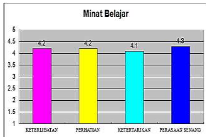
Gambar 5 Minat Belajar