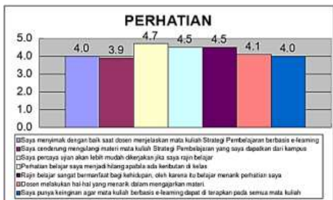
Gambar 3 Indikator Minat Belajar berupa Perhatian

Berdasarkan data di atas dapat dilihat bahwa minat belajar mahasiswa yang mendapat mata kuliah Strategi Pembelajaran berbasis e-learning untuk aspek perhatian secara keseluruhan menunjukkan hasil yang baik. Indikator perhatian mahasiswa terdiri dari 7 indikator menghasilkan 6 indikator hasilnya baik dan 1 indikator hasilnya cukup baik. Indikator dengan hasil tertinggi yaitu mahasiswa bahwa ujian akan lebih mudah dikerjakan jika rajin belajar. Selain