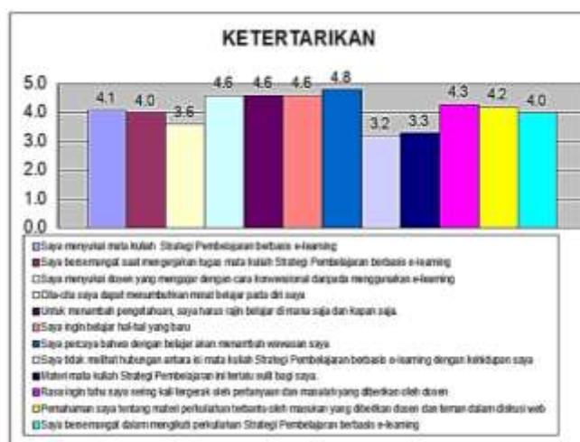
Gambar 1 Indikator Minat Belajar berupa Ketertarikan