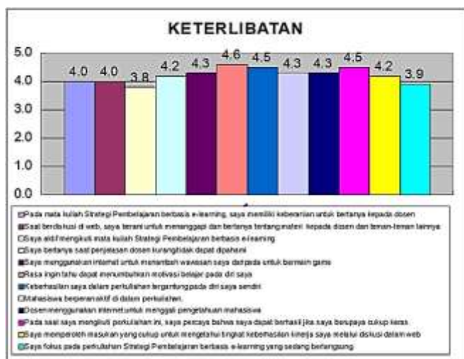
Gambar 2 Indikator Minat Belajar berupa Keterlibatan

keterlibatan secara keseluruhan menunjukkan hasil yang baik. Indikator keterlibatan mahasiswa terdiri dari 12 indikator menghasilkan 10 indikator hasilnya baik dan 2 indikator hasilnya cukup baik. Indikator yang memperoleh hasil tertinggi ialah indikator rasa ingin tahu dapat menumbuhkan motivasi belajar mahasiswa. Indikator yang lain adalah bahwa keberhasilan dalam perkuliahan tergantung dari diri sendiri dan keberhasilan akan diperoleh jika melakukan upaya berupa kerja keras. Sedangkan indikator yang cukup baik terdapat pada mahasiswa ikut aktif terlibat dalam perkuliahan berbasis e-learning dan mahasiswa fokus pada perkuliahan berbasis e-learning yang sedang berlangsung.